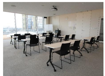
[ミーティングルーム チョウカイ]